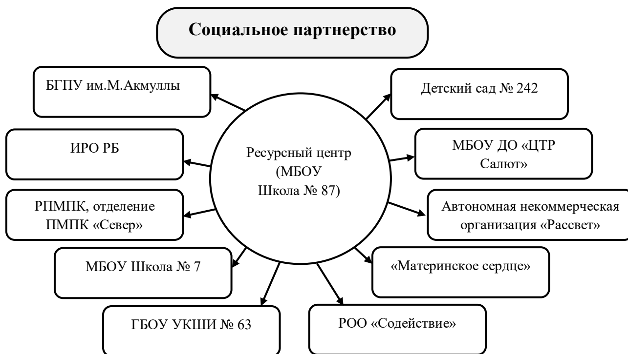
Рис.2 Социальное партнёрство МБОУ Школа № 87 (образец)

Содержание социального партнёрства представляет собой взаимосвязь компонентов: ценностно-смыслового содержания совместной коллективной деятельности субъектов инновационного развития, форм совместной коллективной деятельности; совместного методического проектирования, совместного повышения квалификации участников сетевого взаимодействия, обмена опытом и результатами инновационного развития, взаимного предоставления услуг и взаимообучения, экспертизы и групповой рефлексии.